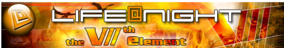
Life@Night - the 7th element