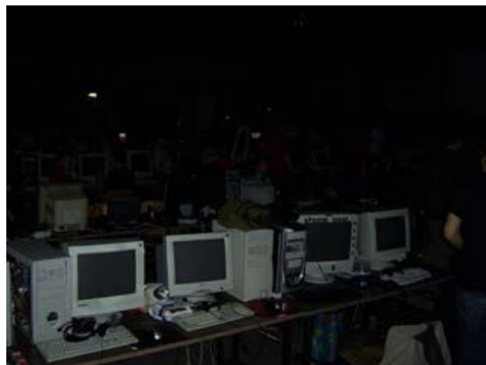
Die stockdunkle Halle

So, es war kürzere Zeit das Internet weg ... lag wohl am Stromausfall. Die Organisatoren wissen den Grund dafür selber nicht, sie vermuten allerdings ein zu heiß gewordenes Kabel. Merkwürdig nur, dass dabei gleich die Hallensicherung springt. Allerdings wurde das 'Problem' relativ rasch gelöst und uns wurden auch noch diese Notleuchtstäbe in die Hand gedrückt, damit's bei uns noch heller wird :D