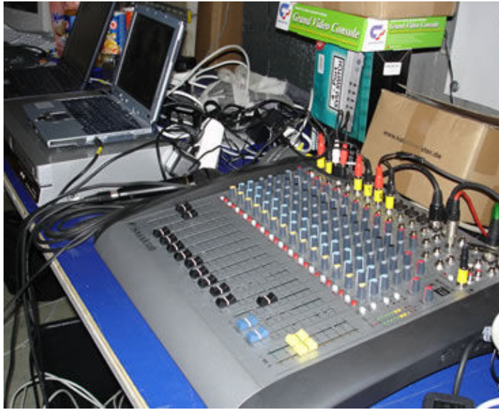
Die Spielwiese von theWon und Imperial ...