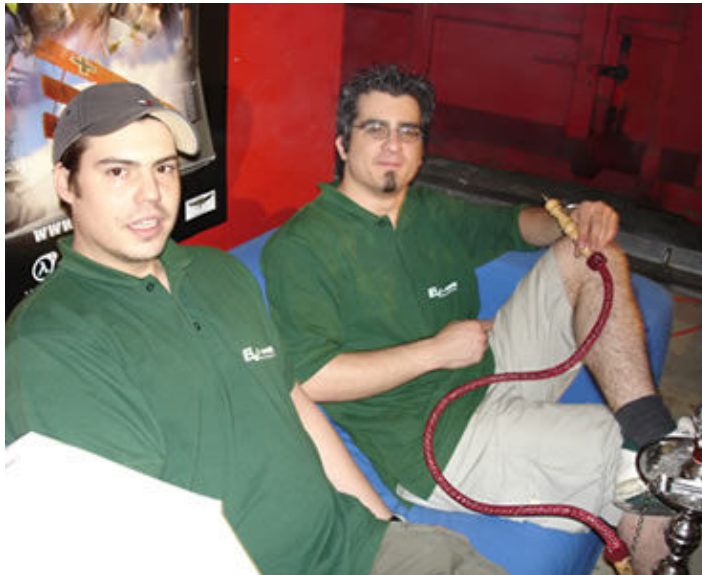
ev-web.at beim chillen

Die Stimmung auf der Lan war teils unheimlich. Selbst die überall anzutreffenden Schreie so mancher CS-Spieler waren einfach nicht vorhanden. Wie auch schon oben angesprochen könnte das an der Teilung der Lan durch die zwei Spurenlagen liegen. Oder evtl aber auch an den fehlenden Sideacts. So darf ich mir erlauben zu sagen, dass das was die MillANium teils zu viel an Sideevents hatte, auf der Downunder4LAN klar fehlte. Doch selbst ist der Mann und PlanetLAN sorgte einfach selber für Stimmung ;o)